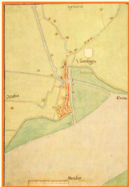
Jacob van Deventer, kaart van Vlaardingen, ca. 1562, 'hetensise'

Wat is er op de kaart te zien en wat kunnen we daar nu nog van herkennen? We starten de wandeling bij de Grote Kerk op de Markt (die vroeger Omring werd genoemd).