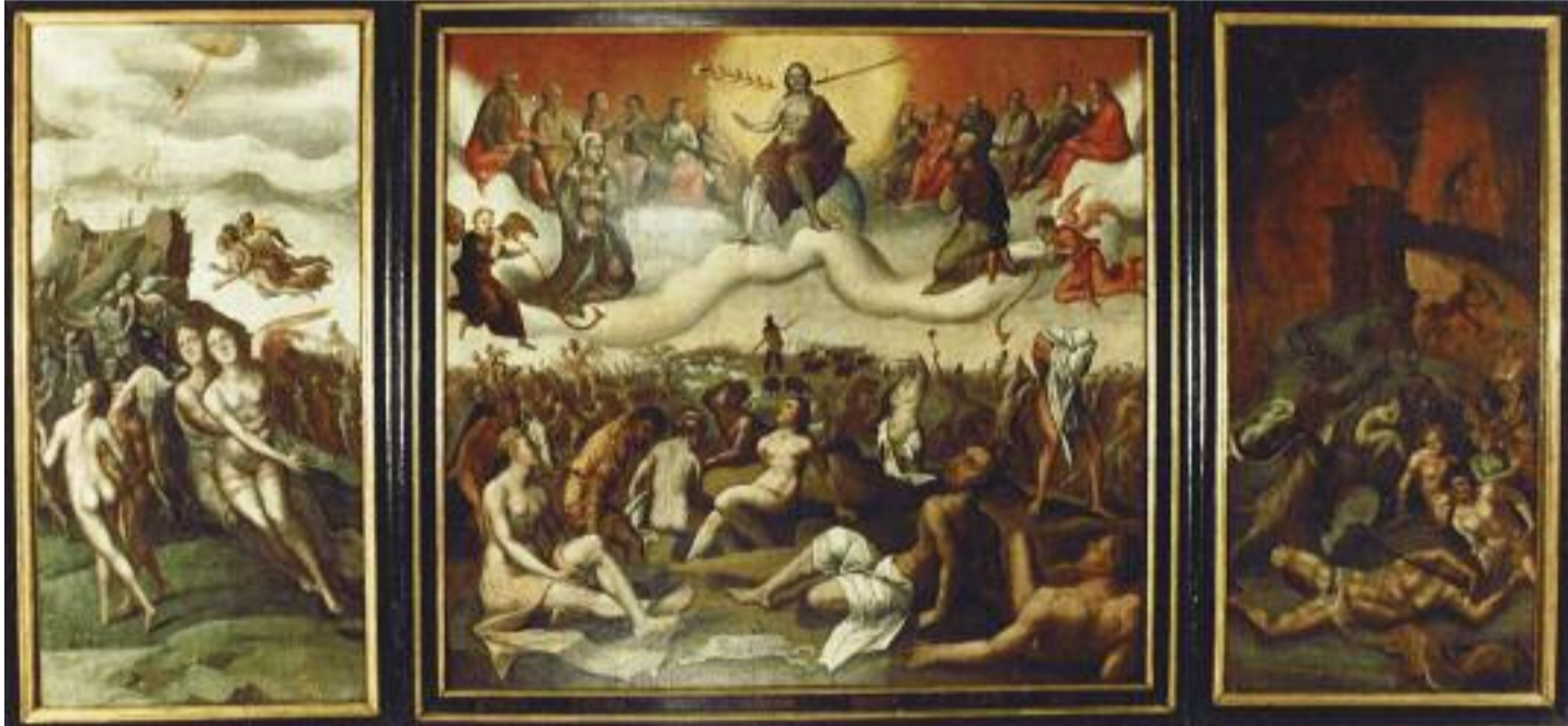
'Het laatste oordeel' drieliuk van Cornelis Schevenink 1555. Het drieliuk is te zien in het gemeentehuis van 's-Gravzande

Ultiem Westlandgevoel bij eerste lustrum van de gemeente.