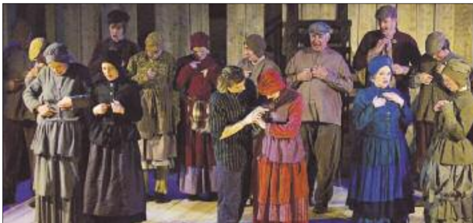
De kus van de Pontamoer opera van Heenweg - januari