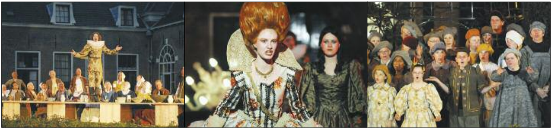
Paleisgeheimen opera van Honselersdijk