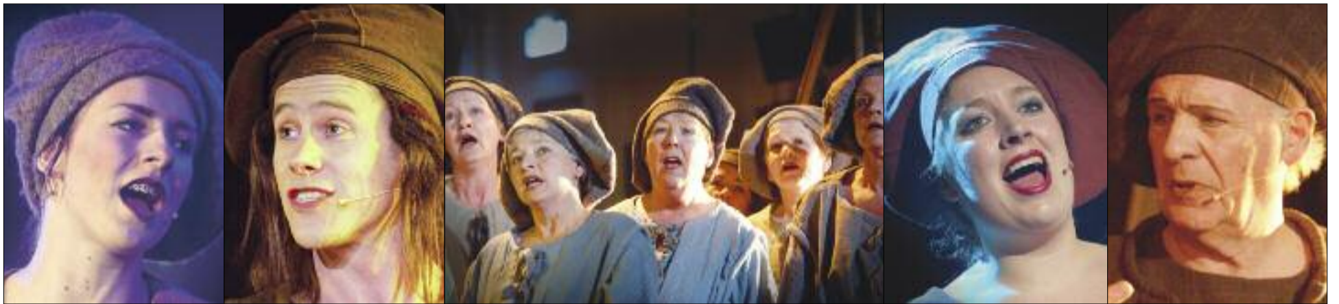
Tussen hemel en hel opera van 's-Gravenzande