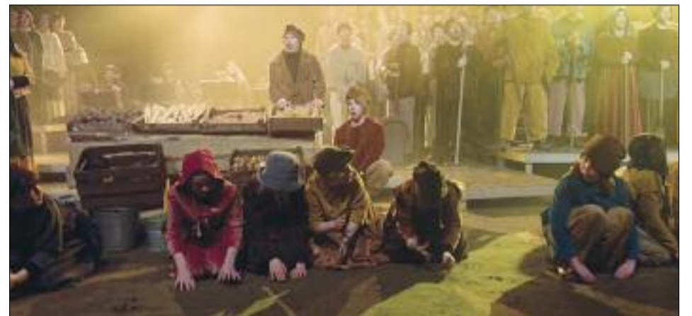
Douglas, beul van een baljuw opera van Naaldwijk - februari

Zin om mee te zingen of achter de schermen mee te werken?