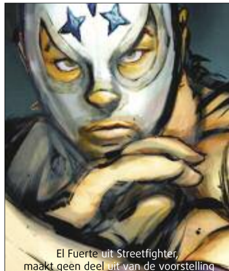
El Fuerte uit Streetfighter, maakt geen deel uit van de voorstelling

Openlucht game-opera in het hartje van Monster